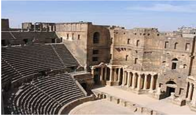
(مسرح بصرى وهو من

ونلاحظ ان في بلاد الشام تنوعت الحضارات و امتزجت فنون العمارة بها وفي الأوابد الأثرية الموجودة نجد انها مركزا لاحدى اقدم الحضارات على وجه الارض [٦] مما جعلها مدخل وبوابة لتاريخ الفن المعماري حيث اقامت فيها المدن الاولى في التاريخ ، مثل المملكة الاثرية إيبلا التي يعود ظهورها الى ٣٠٠٠ قبل الميلاد ومملكة تدمر وتضم ايضا العديد من الحضارات والمدن وقد سكنها شعوب كثيرة منهم السومريين والأكاديين و الرومان