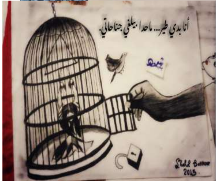
( رسالتي في جمعية حقوق المرأة )