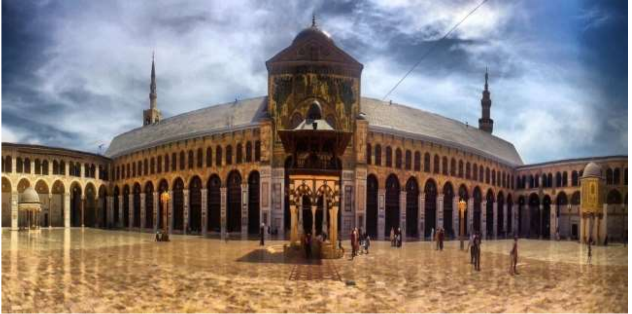
(المسجد الأموي الكبير في دمشق درة الأبنية الإسلامية في العصر الأموي)

يعرف هذا الفن على انه احد اهم الفنون التي ارتبطت ارتباطا وثيقا بما بناه المسلمون على امتداد التاريخ الاسلامي. و تتنوع العمارة الاسلامية بين المساجد ، والقصور ، والقلاع ، ودور الضيافة ، والاضرحة وغيرها ، وهي الفنون الرفيعة اللميزة التي تتنوع اساليبها اعتمادا على المدرسة التصميمية التي تتبعها : كالمدرسة المغربية الاندلس ، والمدرسة العراقية الفارسية ، والمدرسة العثمانية في تركيا ، والمدرسة المملوكية في مصر وبلاد الشام.[٧]