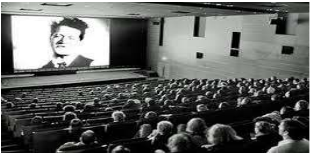
شاشة سينما عملاقة

هناك أنواع من الفن السينمائي الوثائقي ، الذي يحاول إيصال حقائق ووقائع تحدث بالفعل بشكل يهدف الى جذب المشاهد ، او إيصال فكرة او معلومة بشكل واضح وسلس أو مثير للإعجاب[١٢]