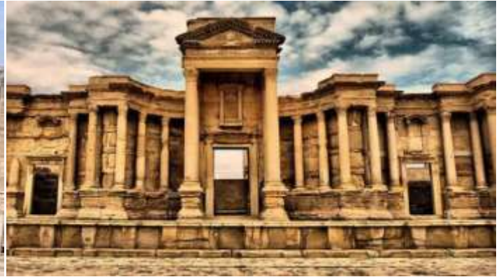
(مملكة تدمر يعود تاريخها الى العصر الحجري القديم ) العصر الروماني)